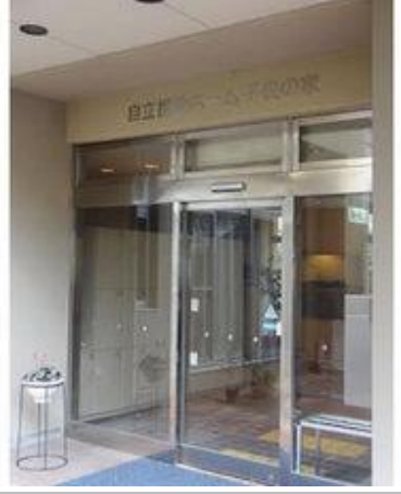
⑯ 神戸市立 子供の家