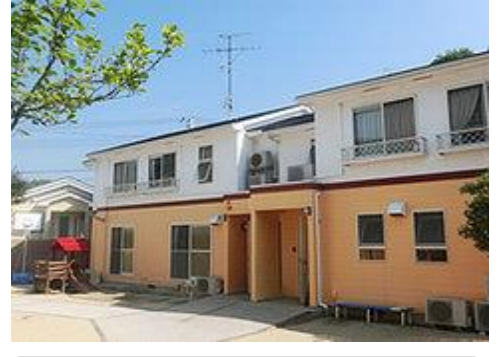
⑫ 長田こどもホーム