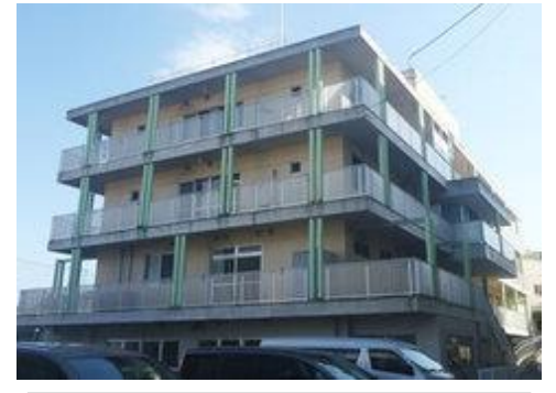
⑩ 夢野こどもホーム