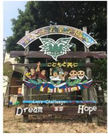
⑮ 神戸市立 若葉学園